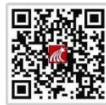
移动图书馆客户端