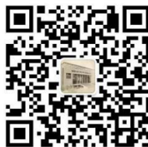
图书馆微信公众号

主办：济宁学院图书馆 地址：山东省曲阜市杏坛路 1 号 邮编：273155 网址： http://lib.jnxy.edu.cn/ 邮箱： sdjnxytsg@163.com 电话：0537-3196102 编辑：济宁学院图书馆资源建设部 联系人：王效慧 邮箱： jnxytsgwxb@qq.com 电话：18653719929