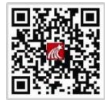
移动图书馆客户端